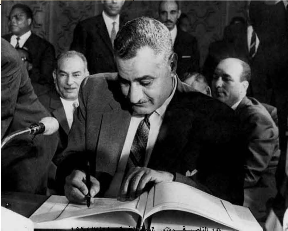
عبد الناصر فى مؤتمر القمة الإفريقى ١٩٦٤/٧/٢٢

كان من الواجب أن يقرر ممثلوا الأمم المتحدة دعوة البرلمان، وتأمينهم.